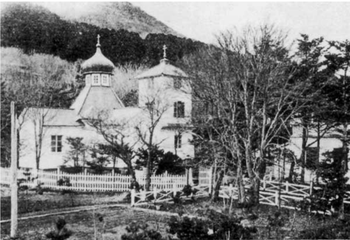
Первая Православная церковь в Хакодате