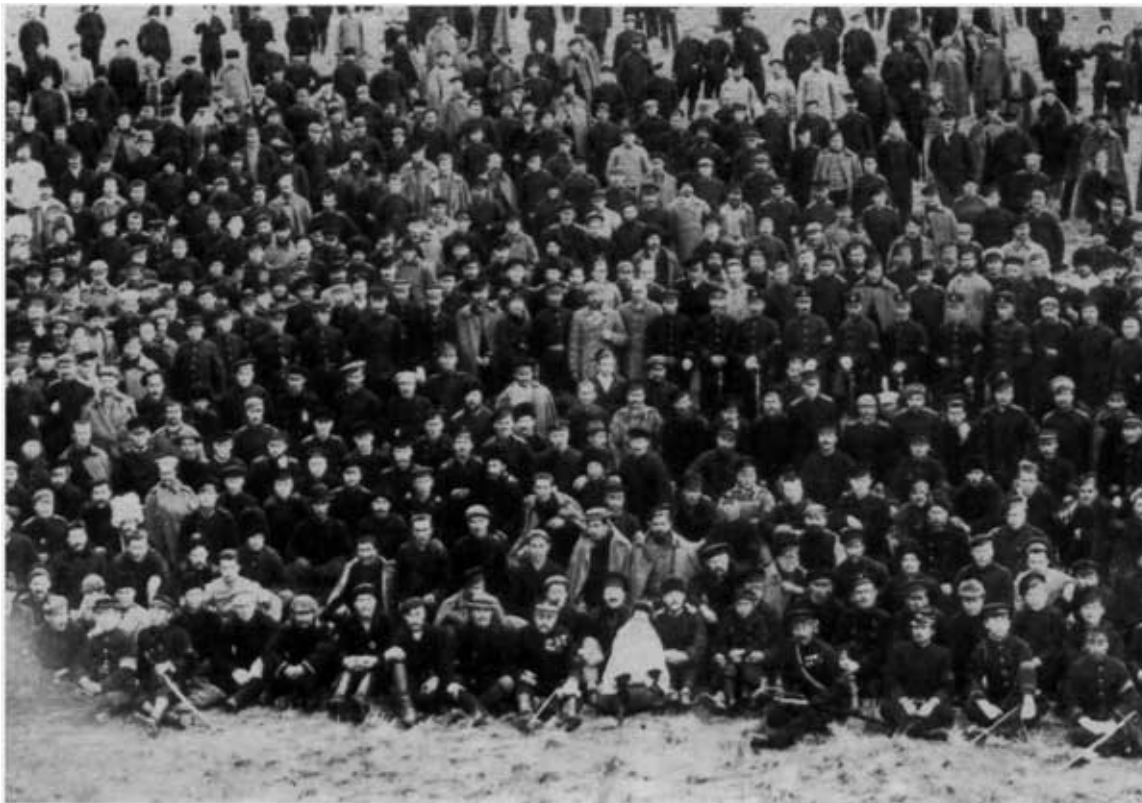
Русские военнопленные в Мацужама (ок. 1905 г.)