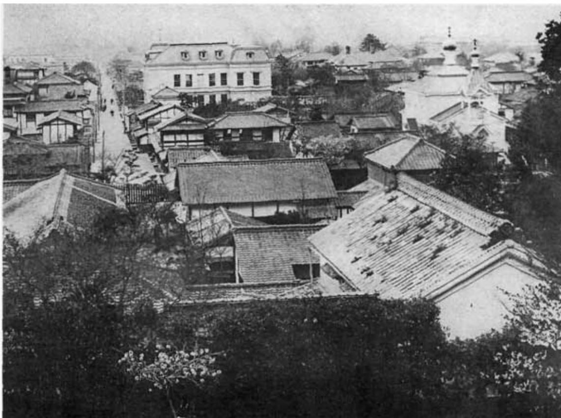
Вид г. Мацуяма. Справа на втором плане видна Православная церковь, построенная в 1908 г. на пожертвования московских благотворителей и русских военнопленных