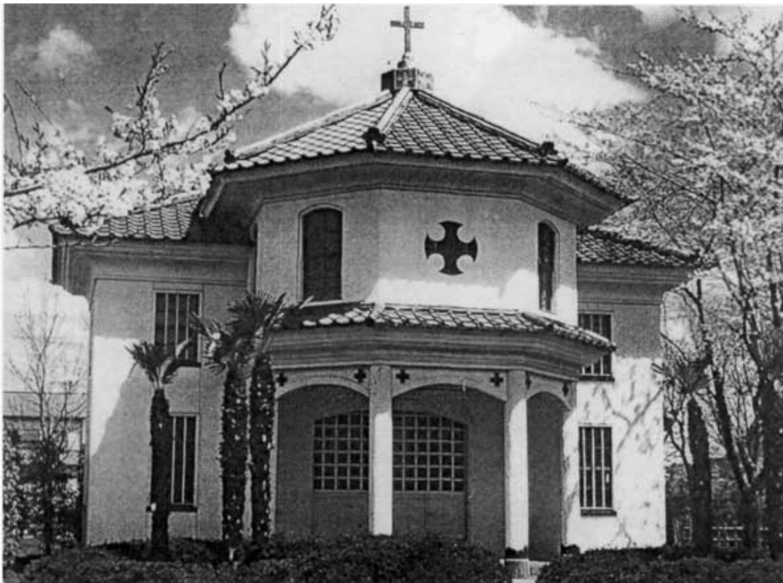
Церковь в г. Исиноками в префектуре Мияги. Построена в 1880 г.