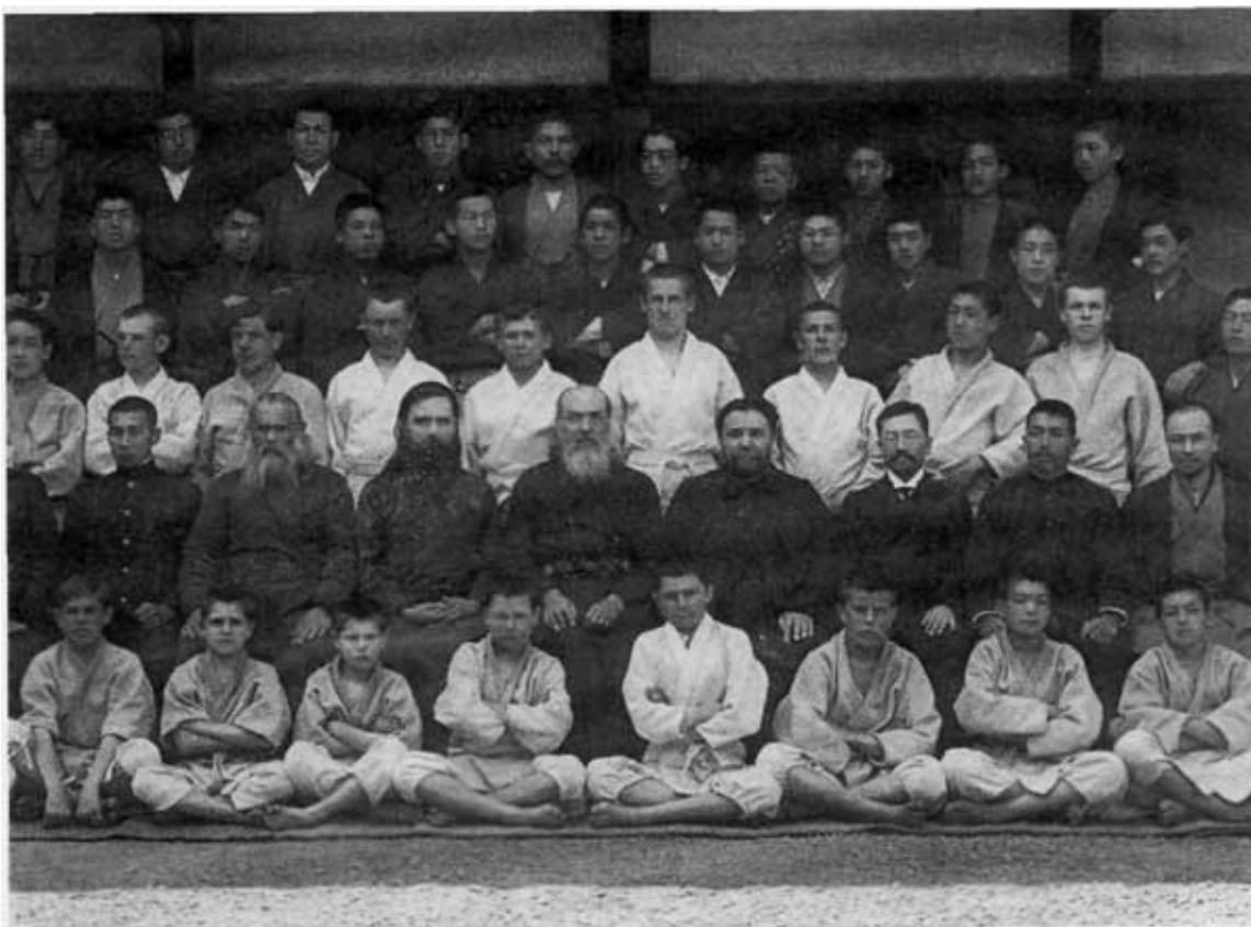
Кружок дзюдо в семинарии. В центре архиепископ Николай, слева от него епископ Сергей (Тихомиров)