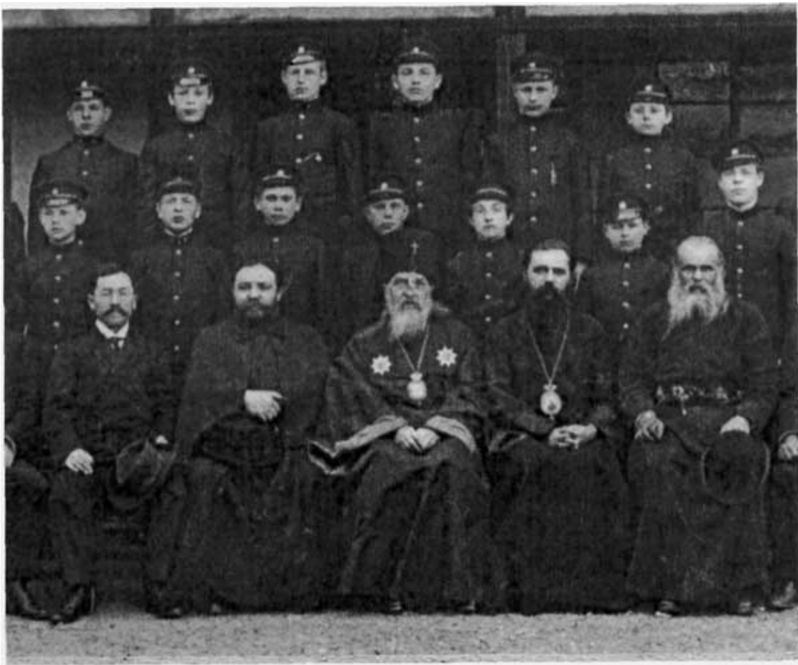
Русские семинаристы в Суругадаи, одетые в форму, и учителя семинарии (ок. 1909 г.).