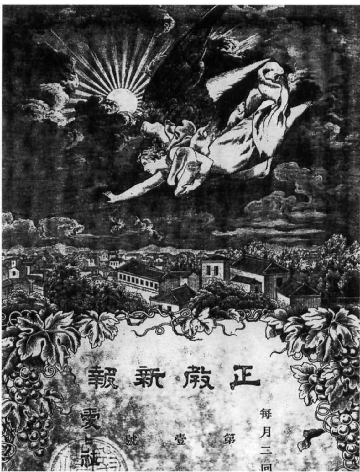
Обложка журнала «Сейко Симпо», № 1 за декабрь 1880 г. Рисунок на обложке Ирины Ямасита