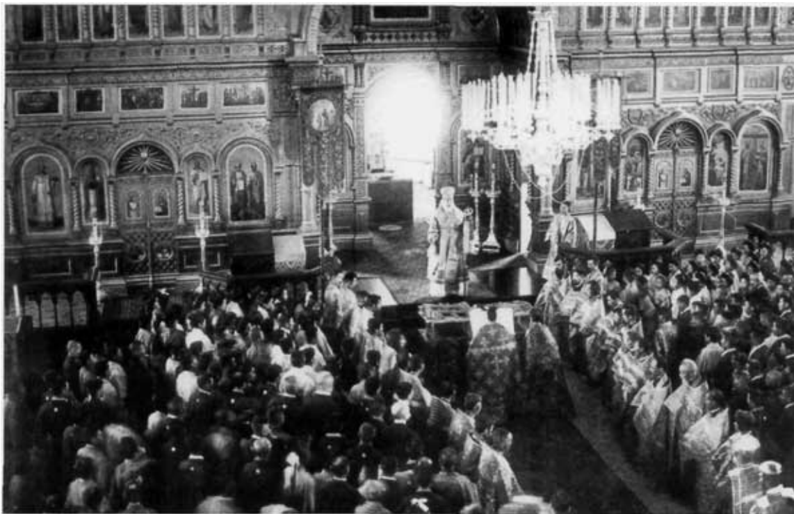
Празднование рукоположения о. Николая во архиепископа (11 июля 1906 г.)