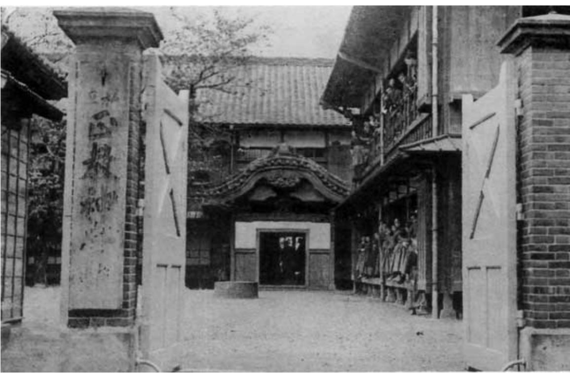
Семинария в Суругадаи